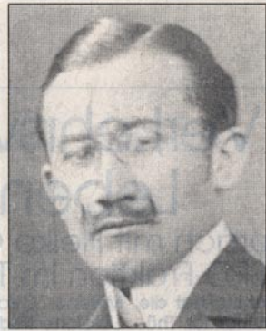
Christian Hülsmeier, 1904